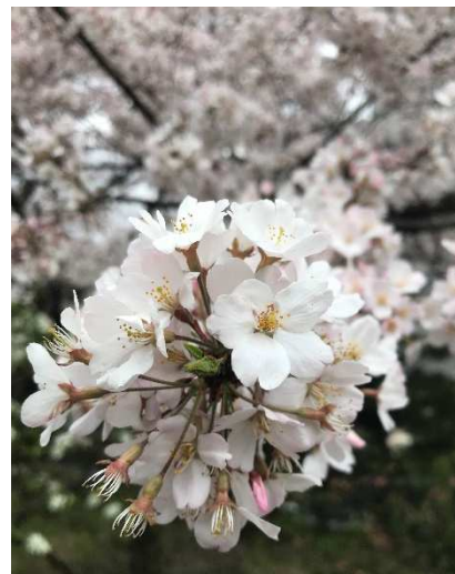
【撮影場所】国立劇場 さくらまつり

公益社団法人首都圏不動産公正取引協議会 ( https://www.sfkoutori.or.jp ) 東京都千代田区麴町1-3 ニッセイ半蔵門ビル3階（〒102-0083） TEL：03（3261）3811